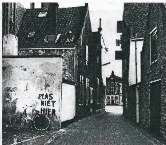
▲ De Windsteeg in 1980...

pullen uit en stinken uren in de wind.” Door een restauratie van het cafépand dat tegen de kerk aan schuurt (vroeger onder meer De Petomaan, nu De Blauwe Engel), keerde veel ten goede. Om aan het wildplassen een eind te maken, werd een urilift, een in de grond verzinkbaar urinoir, geplaatst. Dat schiep wel weer een ander probleem: boze horecaondernemers. (Wichard Maassen)