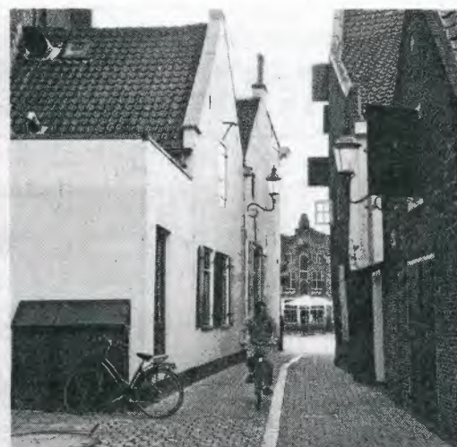
▲ ... en nu.